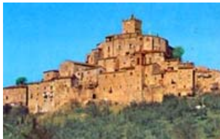
Castello di Montoro