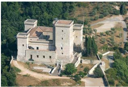
Narni – Rocca di Albornoz

TUTTO QUANTO NON PREVISTO NELLA QUOTA COMPRENDE.